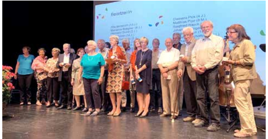
Ehemalige und aktive Vorstände der Nachbarschaftshilfe auf dem Jubiläumsfest

In 50 Jahren haben sich 54 Männer und Frauen als ehrenamtliche Vorstände für den Verein engagiert. Als kleines Dankeschön für ihre wertvolle Arbeit bekamen sie feine Pralinen überreicht.