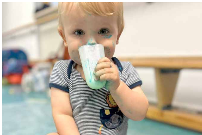
Mit allen Sinnen: Sensorik-Play-Vormittag für die Kleinsten – ein neues Angebot unseres Mütter- und Familienzentrums

Kinder und setzten wichtige Impulse für die Weiterentwicklung des Zentrums. Ob beim Ladies Afternoon oder Sensorik-Play-Vormittag , im Familien-Turn-Café oder Nähkaffee : Überall entstanden Räume für Austausch, gemeinsames Lachen und Erzählen, für Rat und gegenseitige Unterstützung. Ganz im Sinne der Schwarmintelligenz wurde eine lebendige Nachbarschaftshilfe gelebt.