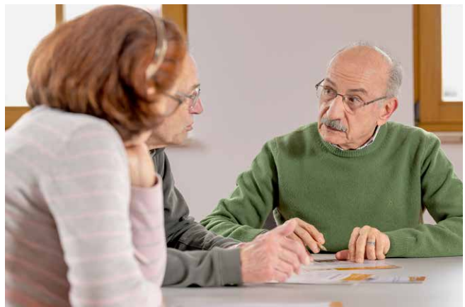
Deutsch lernen mit Lernbegleitung auf Augenhöhe

In Unterhaching fanden in der Lernwerkstatt insgesamt 41 Treffen statt. Die sieben Teilnehmenden stammen aus verschiedenen Ländern, das Verhältnis von Frauen und Männern ist nahezu ausgeglichen. Die Lernwerkstatt versteht sich als Ergänzung zu externen Deutschkursen, die vor allem solides theoretisches Wissen vermitteln. Schwerpunkt der Lernwerkstatt Unterhaching ist die Sprachpraxis, die im Einzelunterricht und in Kleinstgruppen gezielt gefördert wird. Individuelle Begleitung, abwechslungsreiche Materialien und eine offene Lernatmosphäre unterstützen die Freude am Lernen.