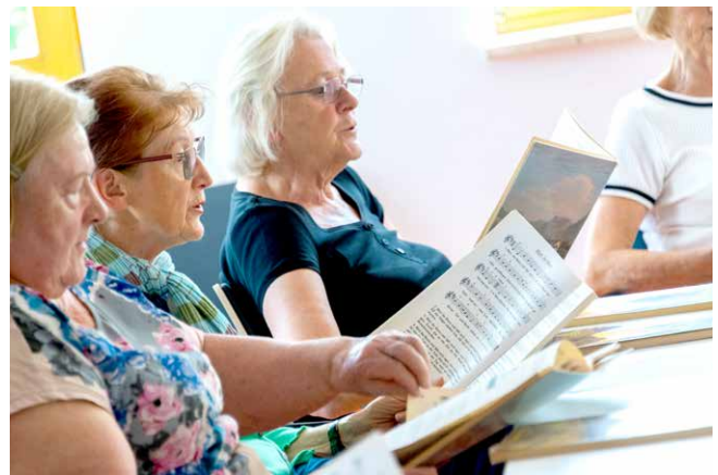
Jeden zweiten Mittwoch im Monat schallt fröhliches Singen durch unser Haus der Nachbarschaftshilfe

Wer den Nachmittag lieber beim Rummikub verbringen wollte, konnte an insgesamt 18 Donnerstagen unserer Spielgruppe beitreten. Die Gruppe mit durchschnittlich acht Spielerinnen und Spielern freut sich immer über Zuwachs und neue Gäste! Die Nachmittage wurden zuverlässig von Ehrenamtlichen vorbereitet und begleitet, unterstützt von köstlichem selbstgebackenem Kuchen zur Stärkung zwischendurch.