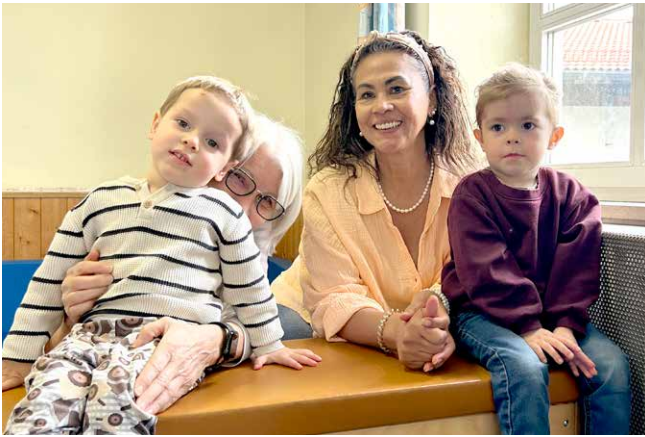
Kleine Entdecker und große Begleiterinnen in der Großtagespflege im Alten Rathaus.

In der Großtagespflege im Alten Rathaus wurden bis zu 10 Kinder betreut (14.116 Stunden). Die Kinder kamen gern, genossen das Miteinander und wuchsen an gemeinsamen Erlebnissen. Spaziergänge, Ausflüge und kreative Angebote prägten den Alltag und stärkten Bewegung, Gemeinschaft und soziale Kompetenzen. Eine liebevolle, verlässliche Betreuung sowie eine wertschätzende Atmosphäre sorgten für Wohlbefinden und eine gute Entwicklung.