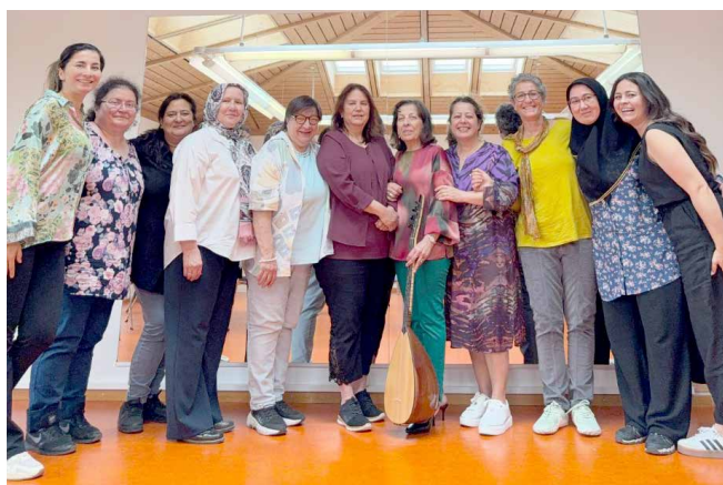
Fröhlicher Frauen-Treff in unserem schönen Dachgeschoss

Mit dem Erlös unterstützte der Basar die vielfältigen Angebote der Nachbarschaftshilfe nachhaltig. Dafür bedanken wir uns herzlich bei unserem familiären Basar-Team!