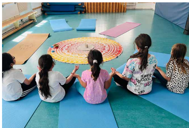
Die Matten für unsere kleinen Yogis wurden vom SV-DJK Taufkirchen gespendet. Herzlichen Dank!

Es wurden verschiedene Kinder- und Familienworkshops angeboten, darunter Infoveranstaltungen zu finanzieller Unterstützung für Getrenntlebende und Alleinerziehende mit neun Teilnehmenden, zwei Yoga-kurse für Grundschul Kinder (mit jeweils zehn Teilneh-