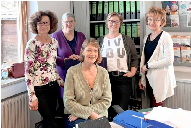
Ein organisatorisches Herzstück unserer Arbeit: das Büroteam im Haus der Nachbarschaftshilfe in Taufkirchen

Die beiden Geschäftsstellen in Taufkirchen und Unterhaching mit täglichen Öffnungszeiten waren stark frequentiert. Die Büroteams kümmerten sich mit großer Aufmerksamkeit und Einfühlungsvermögen um die vielfältigen Anliegen und Fragen der Bürgerinnen und Bürger in Taufkirchen und Unterhaching. Als zentrale Anlaufstellen für Information, Beratung und Anmeldung zu den zahlreichen Angeboten der Nachbarschaftshilfe sind die Geschäftsstellen für viele Menschen der erste Kontaktpunkt.