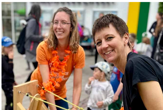
Zum Entzücken der Kinder waren wir beim Kinder- und Familientag Unterhaching mit unserer Schaumkuss-Weitwurfmaschine dabei

Unser offenes Ladies Afternoon -Angebot zaubert auch im dritten Jahr in Folge jeden letzten Mittwoch im Monat ein leckeres Buffet und ein buntes Bastelangebot für Kinder und Frauen jeden Alters. Mit rund 20 bis 25 Besucherinnen inklusive Kinder erreichte der Gruppenraum oft seine Kapazitätsgrenze.