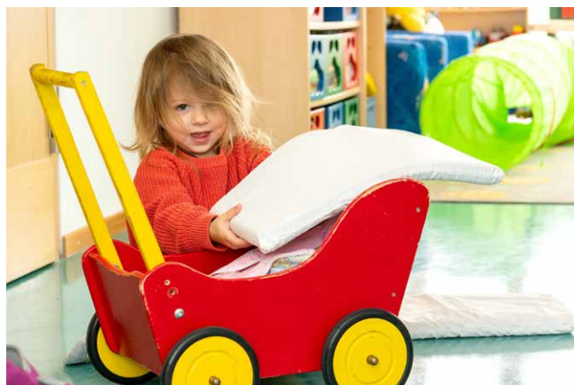
Spielend die Welt entdecken im Spielkreis

Vereine, der Kinder- und Familientag Unterhaching und der Weihnachtsmarkt bei Tilas Musikwelt – konnte das Zentrum seine Sichtbarkeit deutlich steigern.