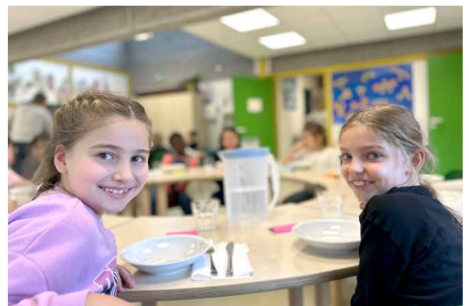
Zwischen Schule und Zuhause: Zeit zum Mittagessen, Durchatmen, Spielen und Zusammensein

willkommen heißen. Die Eingewöhnungsphase verlief behutsam, sodass sich die Kinder schnell sicher und gesehen fühlten. Insgesamt wurden im Berichtsjahr 37 Kinder betreut. Vier Festangestellte, eine Minijobberin, zwei Ehrenamtliche und ein Bufdi sorgten dafür, dass sich die Kinder wohlfühlen konnten. Das Team arbeitete pädagogisch sorgfältig und blickt motiviert auf ein weiteres kreatives Jahr.