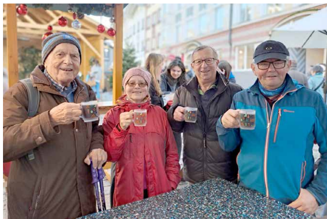
Die Mittwochs-Spazierer beim Besuch am Christkindlmarkt

für ältere Menschen. Seit Februar treffen sich sechs wanderfreudige Damen und Herren aus Unterhaching und Taufkirchen regelmäßig, um gemeinsam unterwegs zu sein und die Natur zu genießen.